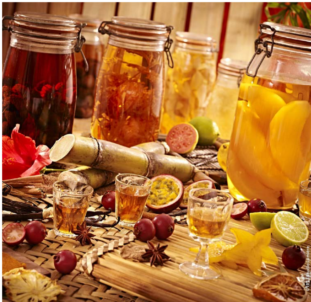
L'abus d'alcool est dangereux pour la santé, à consommer avec modération.

Chaque famille, table d'hôte ou restaurant a concocté sa recette. Vos sens seront d'abord stimulés par la vue des magnifiques jarres enfermant fruits, feuilles ou écorces de plantes aromatiques, macérés dans un rhum savamment dosé en sucre.